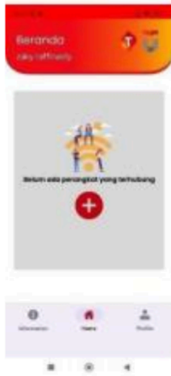
Gambar 4 Tampilan Connect Alat Mobile App

Pada halaman connect alat, user diharuskan mengklik tanda “+” pada layar untuk menghubungkan alat yang digunakan agar bisa terlacak pada tampilan maps, nanti akan terhubung otomatis pada alat yang digunakan.