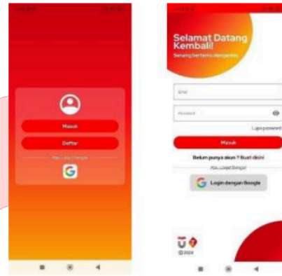
Gambar 2 Tampilan Login Mobile App

Pada halaman Login pengguna diharuskan untuk mengklik tombol panah yang akan merujuk pada halaman pemilihan untuk Login atau Register. Pengguna bisa menggunakan akun Google nya untuk melakukan Login jika tidak ingin mengisi username dan password.