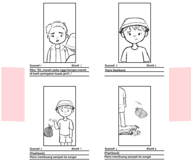
Gambar 3.4 Storyboard ILM “Mancing Sampah, Bukan Ikan” Bagian 4