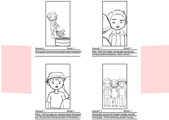
Gambar 3.6 Storyboard ILM “Mancing Sampah, Bukan Ikan” Bagian 6