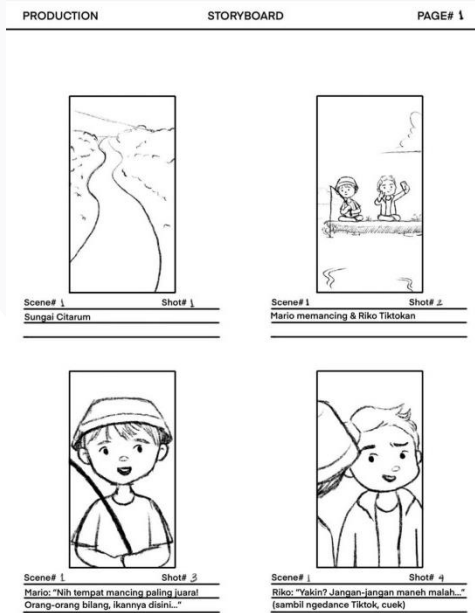
Gambar 3.1 Storyboard ILM “Mancing Sampah, Bukan Ikan” Bagian 1