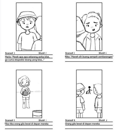
Gambar 3.5 Storyboard ILM “Mancing Sampah, Bukan Ikan” Bagian 5