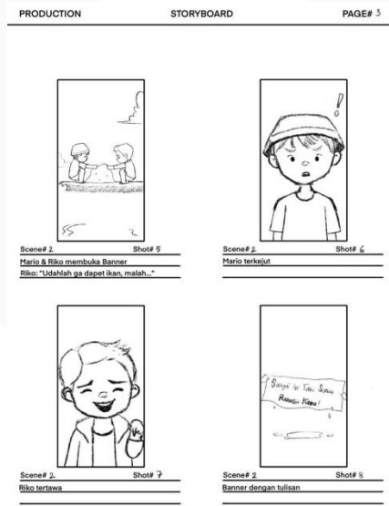
Gambar 3.3 Storyboard ILM “Mancing Sampah, Bukan Ikan” Bagian 3