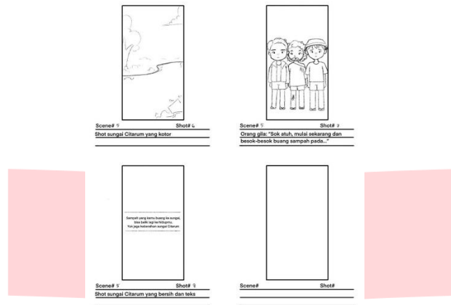
Gambar 3.8 Storyboard ILM “Mancing Sampah, Bukan Ikan” Bagian 8