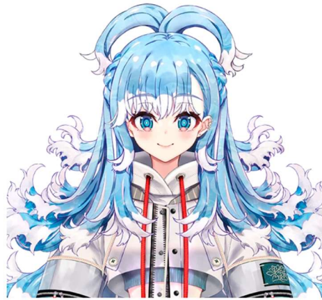
Gambar 1.1 Kobo Kanaeru

hujan terkuat di daerahnya. Ia memiliki bakat luar biasa dalam mengendalikan hujan, tetapi tidak suka dimanfaatkan oleh orang lain untuk menggunakan kekuatannya. Untuk mendapatkan kembali gelar "Pengendali Hujan," ia harus membuktikan kepada keluarganya bahwa ia mampu meneruskan usaha pawang hujan keluarga. Selain berlatih setiap hari, ia juga harus merancang strategi pemasaran virtual agar usahanya berhasil. (hololivepro, 2022). Hal ini tidak hanya membedakannya dari idola virtual dan tradisional, tetapi juga menegaskan bahwa idola virtual dapat menjadi apa saja dengan kemampuan yang melampaui manusia pada umumnya.