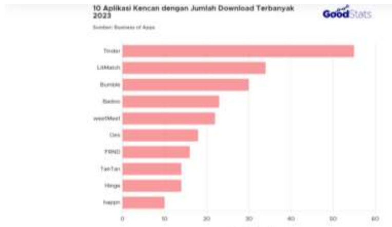
Gambar 1.5 Data Statistik Aplikasi Kencan Online di dunia