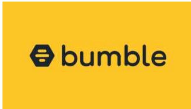
Gambar 1.1 Logo Aplikasi Bumble