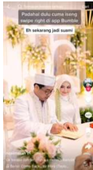
Gambar 1.3 Keberhasilan Pengguna Aplikasi Bumble