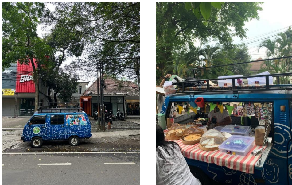
Gambar 1. 3 Warung Ubi Ibu

Di bawah ini merupakan gambar dari smoke truck yang digunakan oleh Warung Ubi Ibu dalam menjalankan operasional bisnisnya.