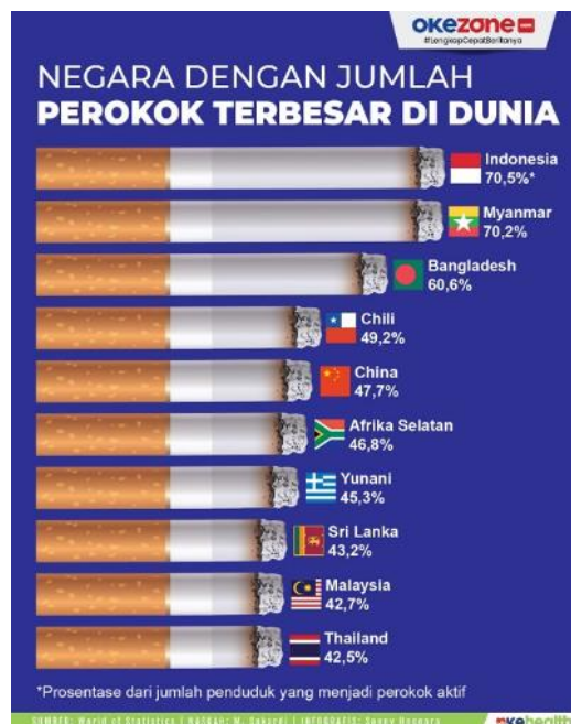
Gambar 1.1 Negara dengan Jumlah Perokok Terbesar di Dunia

Merokok menjadi kebutuhan yang tak terhindarkan bagi orang yang memiliki kecenderungan terhadap rokok. Meskipun merokok diketahui merugikan kesehatan, kebiasaan ini telah menjadi bagian dari gaya hidup dan bahkan kebutuhan bagi individu dari berbagai kelompok usia. Sulit mengubah kebiasaan ini, terutama di Indonesia yang merupakan salah satu negara dengan jumlah perokok terbanyak di Asia (Sumber: infografis.okezone.com 2023). Pertumbuhan perokok aktif di Indonesia juga didukung oleh industri tembakau yang agresif memasarkan produknya, terutama kepada anak-anak dan remaja melalui media sosial, menggunakan berbagai strategi seperti merek multinasional, influencer, tren populer, dan pengenalan merek tembakau serta nikotin di media sosial ( sehatnegeriku.kemkes.go.id 2024).