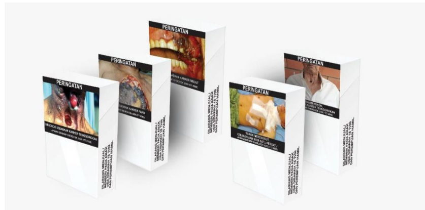
Gambar 1.2 Kemasan Rokok