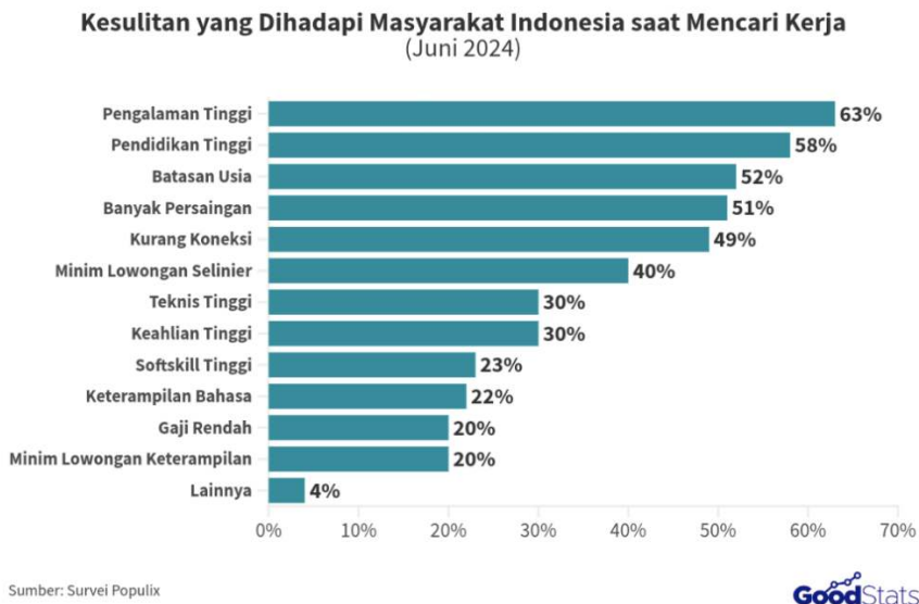
Gambar 1.3 Kesulitan yang Dihadapi Masyarakat Indonesia Saat Mencari Kerja

Di Telkom University, program magang merupakan upaya penting dalam membekali mahasiswa dengan pengalaman kerja langsung melalui pembelajaran berbasis pengalaman ( experiential learning ) yang mengembangkan hard skills dan soft skills . Program ini juga menguntungkan industri karena memungkinkan mereka merekrut calon tenaga kerja yang sudah familiar dengan dunia kerja (BPA Telkom University, 2024). Selain pengalaman kerja, motivasi juga menjadi faktor penting dalam kesiapan kerja. Motivasi adalah dorongan internal dan eksternal untuk mencapai tujuan, termasuk kesiapan menghadapi dunia profesional (Harling & Sogen, 2018). Fauziah et al. (2023) menemukan bahwa motivasi kerja mahasiswa Universitas Buana Perjuangan Karawang berpengaruh signifikan terhadap kesiapan kerja, didorong oleh harapan jabatan, peningkatan kemampuan, kebutuhan keluarga, dan cita-cita hidup sejahtera. Menurut Goleman dalam Suryaningsih et al. (2024), individu dengan motivasi tinggi mampu mengelola emosi, menghadapi tantangan, dan menjaga fokus pada tujuan jangka pendek dan panjang—kualitas penting di dunia kerja.