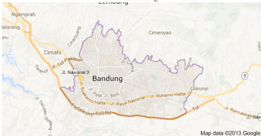
Gambar 1.1 Peta Kota Bandung

Kota Bandung merupakan kota metropolitan terbesar di Jawa Barat sekaligus menjadi ibu kota provinsi tersebut. Kota ini terletak 140 km sebelah tenggara Jakarta, dan merupakan kota terbesar ketiga di Indonesia setelah Jakarta dan Surabaya menurut jumlah penduduk. Kota Bandung merupakan kota terpadat di Jawa Barat, di mana penduduknya didominasi oleh etnis Sunda, sedangkan etnis Jawa merupakan penduduk minoritas terbesar di kota ini dibandingkan etnis lainnya. (Sumber: Wikipedia, 2014)