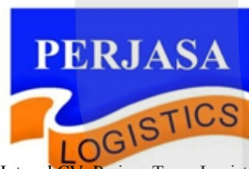
Gambar 1.1 Logo Perusahaan